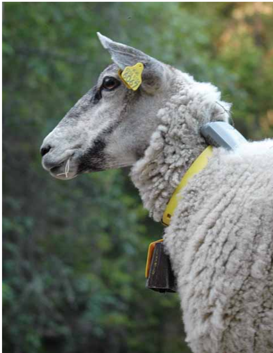
Søye med elektronisk sporingsutstyr trygt plassert på nakken, slik den skal henge for å fungere optimalt.

bjølle er som regel ikkje tung nok til å halde batteriboksen oppe på nakken på dyra. Utan bjølle vert det vanskelegare å drive sanking og tilsyn i tett skog.