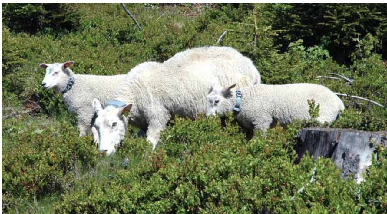
Søye med GSM (hovedenhet) og lam med UHF (underenhet) på Romeriksåsen i Akershus.