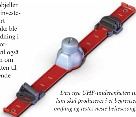
Den nye UHF-underenheten til lam skal produseres i et begrenset omfang og testes neste beitesesong.

Dersom du ønsker å ta i bruk elektronisk sporingsutstyr kommende beitesesong bør du raskest mulig starte planleggingen. Det kan være lurt å tenke samarbeid med andre saueiere. Det lokale beitelaget kan evt. stå som søker av tilskuddsmidler og være med på å organisere et samarbeid om opplæring og bruk av utstyret. Ta gjerne en telefon til landbruksforvaltningen i kommunen eller til fylkesmannen. Det er viktig å gi produsenten tidlig beskjed om behovet for antall